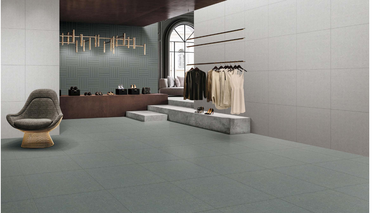
GRIS & GRIS PÂLE