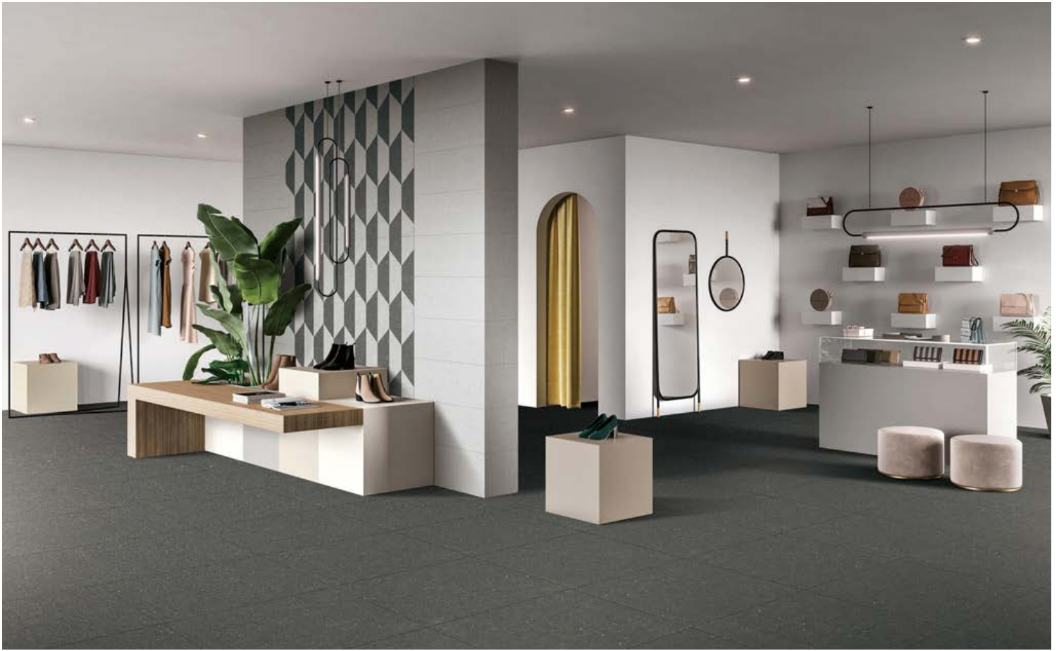
NOIR & GRIS PÂLE